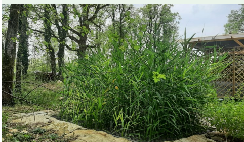
Phytoépuration en fonctionnement

**Et la possibilité d'un prêt à taux zéro pour la mise en conformité d'une résidence principale achevée depuis plus de 2 ans.