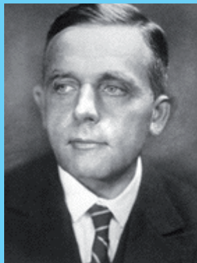
Otto WARBURG Médecin physiologiste et biochimiste allemand Il fût lauréat du Prix Nobel de physiologie et de médecine

Lorsque le sang devient acide, la fatigue et les premières maladies arrivent avec les rhumes, les maux de tête et les douleurs d'estomac. Quand le sang devient encore plus acide, certaines cellules meurent ou deviennent des cellules anormales. Ces cellules sont appelées « cellules malignes ». Ces cellules ne répondent plus aux ordres du cerveau ni au code génétique. Aussi, ces cellules se développent indéfiniment et sans ordre.